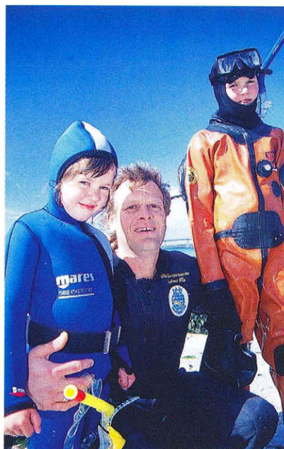
La plongée, loisir populaire en Norvège, est pratiquée très tôt.

Cap sur Molde ensuite, étape réputée de sports nature avant de se diriger vers la route de "l'Atlantique". Cette dernière est une succession de ponts aériens enjambant la mer avec un embarcadere où accostent des bateaux traditionnels en bois, faisant la navette entre le pont et un ancien village de pêcheurs bâti en pleine eau, reconverti en auberge et musée, le